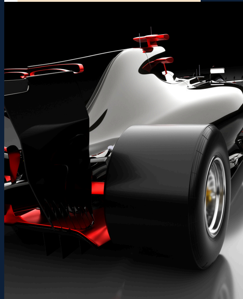
AUTO - MOTO